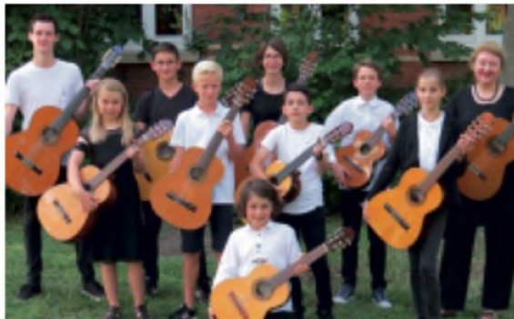
Das Gitarren-Ensemble der Musikschule Korntal-Münchingen

Für Getränke und Pausenverpflegung wird gesorgt. Schüler der Musikschule Korntal-Münchingen sind vom Teilnehmerbetrag befreit, alle mit anreisenden Lehrkräfte ebenso.